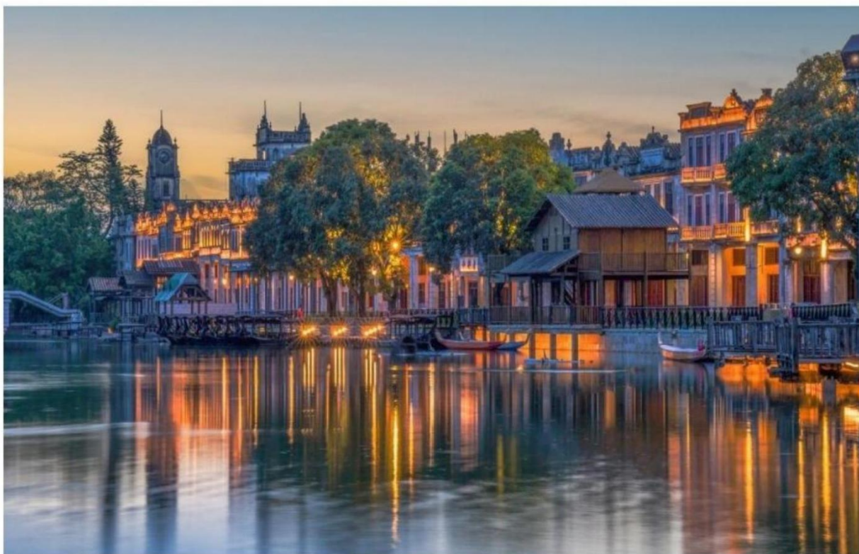
世界龍岡親義總會第十九屆懇親代表大會會場